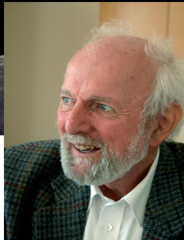
Prof. Dr. Ernst Ulrich von Weizsäcker, Ehrenpräsident des Club of Rome

Steinenring 20, Basel , Tram Nr. 1/8, bis Zoo Bachletten